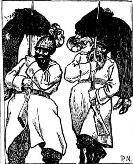
דיא רויטע רעזינירונג ערקלערט, אז אירכה, דיא אירען זיינען יעצט און רוסלאנד ווער, ג. ע. ה. י. ב. ע. — פון פארגעס זיי פשוט אירם איר דער לופטען...