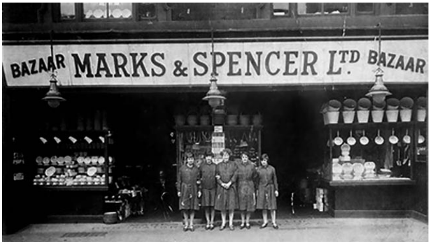
Один из первых магазинов «Маркс и Спенсер»