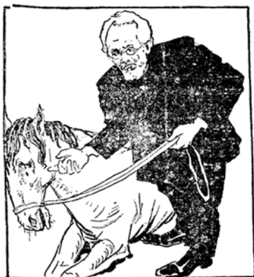
ליטימי ברבני פיעה דמיטוך בעמי .